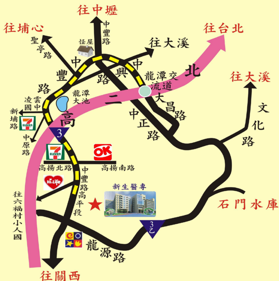
新生醫護管理專科學校新校區位置圖 325桃園縣龍潭鄉中豐路高平段418號